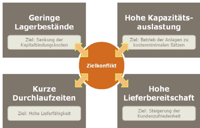
Zielkonflikt der Produktionsplanung- und -steuerung

Die Produktion in der Industrie erfolgt unter zunehmend hohem Preis-, Kosten- und Termindruck. Die Forderung nach geringen Materialbeständen, hoher Kapazitätsauslastung, kurzen Durchlaufzeiten und hoher Lieferbereitschaft rückt immer weiter in den Fokus der Unternehmen. Die vorhandenen IT-Prozesse genügen diesen Forderungen nicht immer – eine kritische Prüfung empfiehlt sich. Verbesserungspotenziale sind auf Machbarkeit zu überprüfen und umzusetzen. Für die Optimierung der Produktionsplanung und -steuerung mit SAP stehen hierfür mehrere Lösungsmöglichkeiten zur Verfügung.